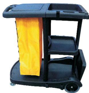
Carro con doble bolsa y doble manubrio